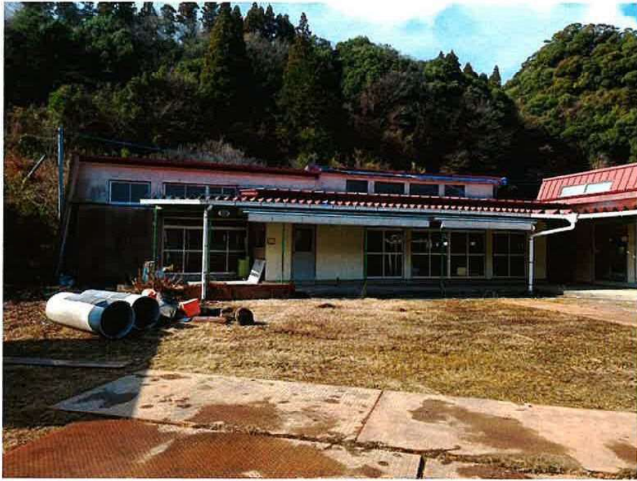
旧巖木幼稚園 着工前（東）