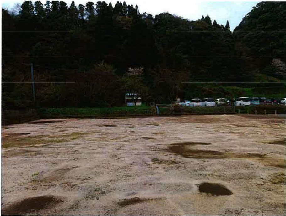
旧巖木幼稚園 完了（東）