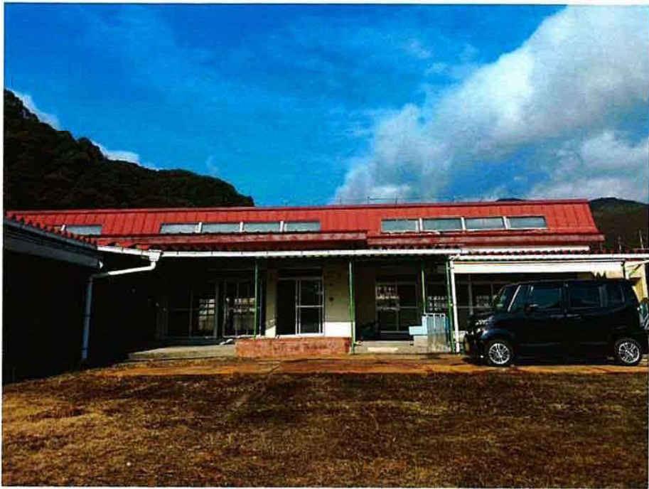
旧巖木幼稚園 着工前 (南)