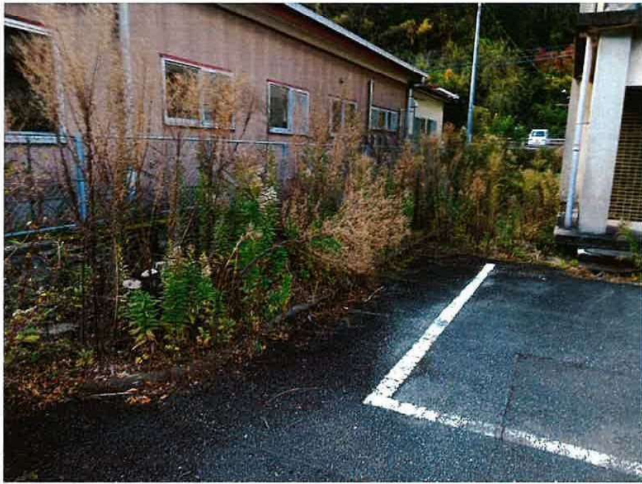
旧巖木幼稚園 着工前（北東）