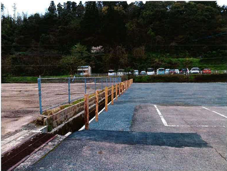
旧巖木幼稚園 完了（北東）