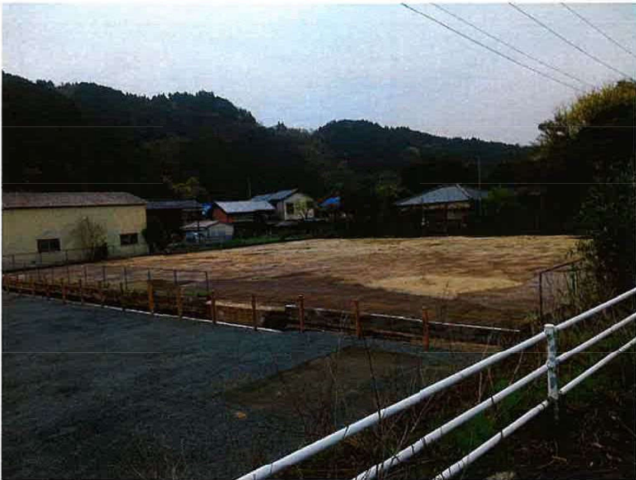
旧巖木幼稚園 完了（北西）