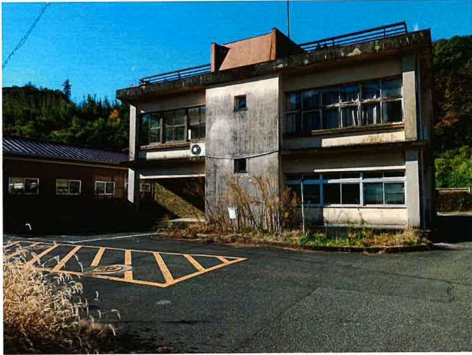
旧巖木公民館支館 着工前（東）