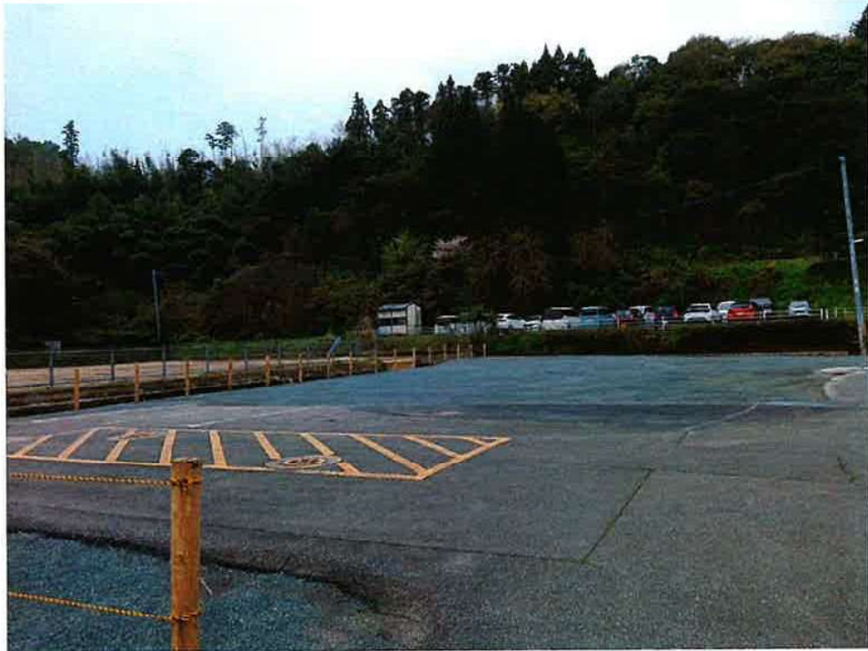
旧巖木公民館支館 完了（東）