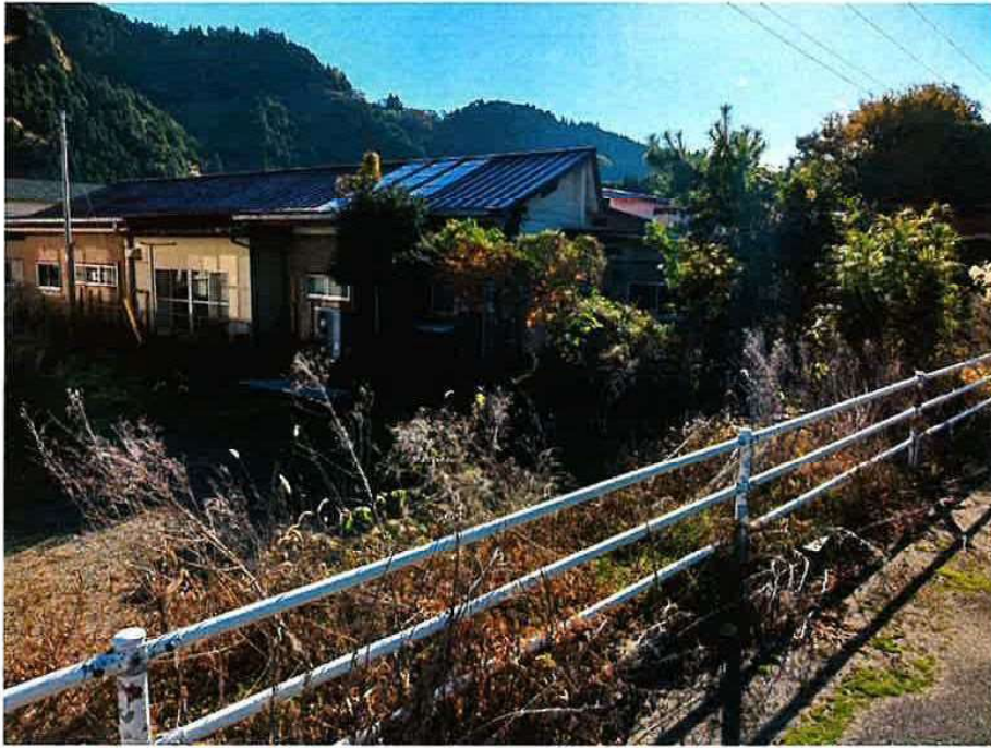
旧巖木幼稚園 着工前（北西）