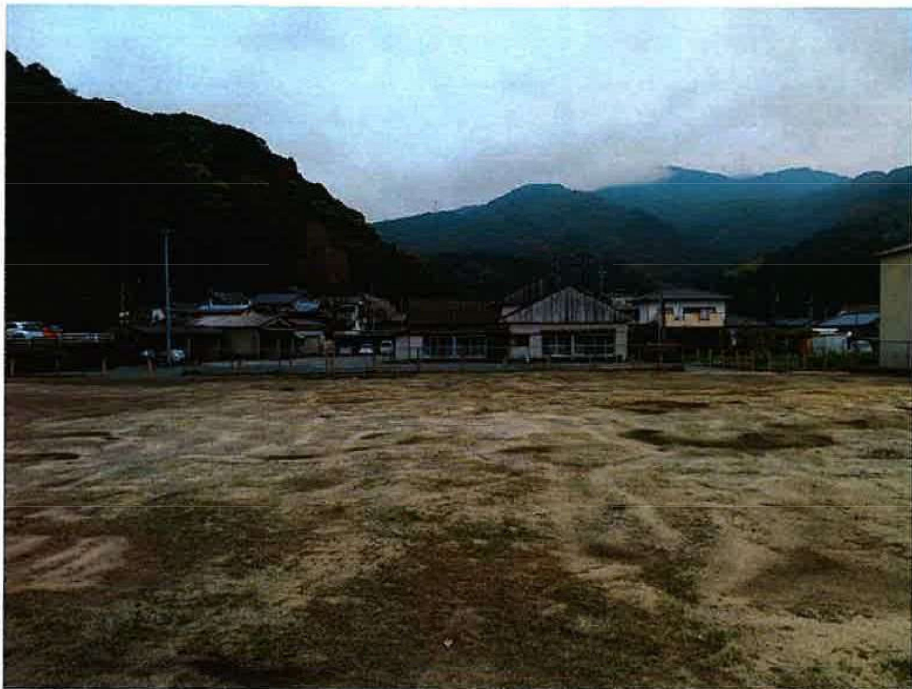
旧巖木幼稚園 完了 (南)