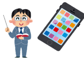
講師を呼んで WEBマーケティングの 勉強会を開催