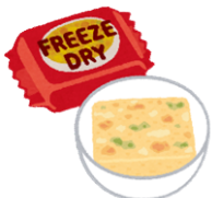
フリーズドライ 製品の開発