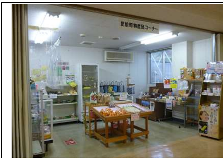
メモ 物産コーナー