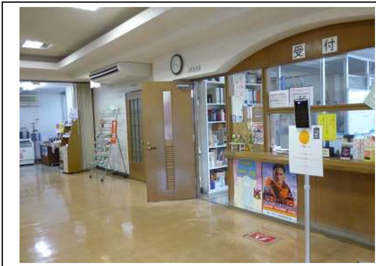
メモ 玄関右手 受付・事務室