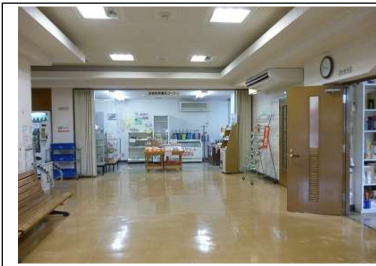
メモ 玄関入口正面

担当課 肥前市民センター総務・福祉課 所在地 唐津市肥前町田野甲1287番地10 撮影年月 令和4年11月