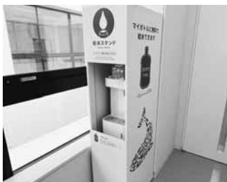
マイボトル用給水スポット

ぐ。運搬方法は唐松環境整備事業組合にお願いすることになるが、県や業界団体を通して、県内外から広く支援を要請する。緊急時の人員体制・応援体制については、災害廃棄物の処理体制と併せて広域連携を視野に整理する。