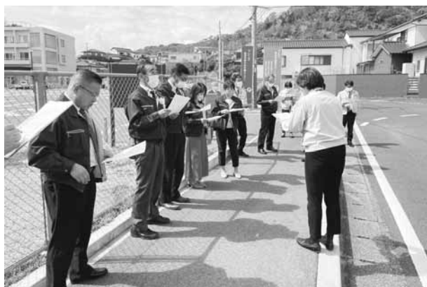
青葉保育園（二夕子）