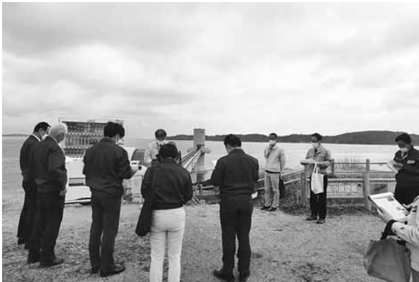
玄海海中展望塔（鎮西町）