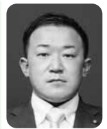
黒木 初 (日本共産党 唐津市議員)