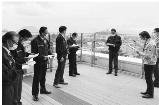
旧唐津市庁舎（西城内）

委員会では、高騰する建設費に対し建設費や維持管理費の削減など将来負担を考えた設計となるように求めた。