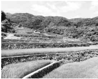
棚田百選 蕨野の棚田