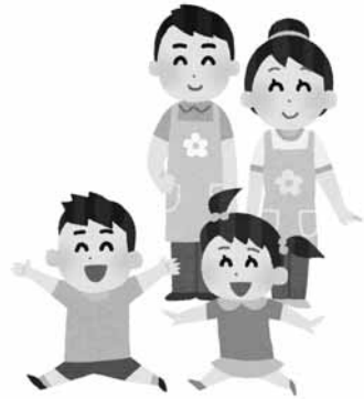
保育士応援事業 QRコード

保健 市報、ホームページの他、県内外の保育士養成学校にチラシを郵送し、移住検討者にも周知した。