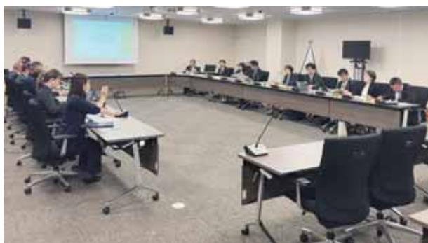
滋賀県甲賀市での視察状況