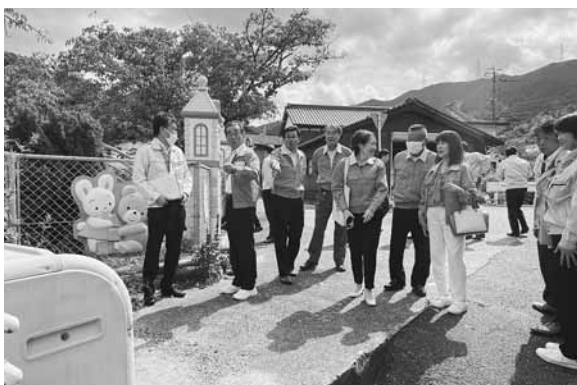
平原保育園（浜玉町）

質疑 特定空家認定後、助言又は指導↓約1〜3か月置いて事前通知↓（約2か月置いて）命令↓（約4か月置いて）行政代執行の戒告。特定空家に認定されてから約1年〜1年半。今回の法改正で緊急の場合は命令に係る手続きを省く事ができ、6か月間の手続き期間を省く事ができる。