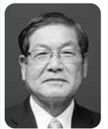
浦田 関夫 (日本共産党 唐津市議員)