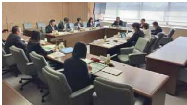
京都府大山崎町での視察状況

市民目線の議会だよりを目指して編集委員会のメンバー全員で編集作業を行っています。