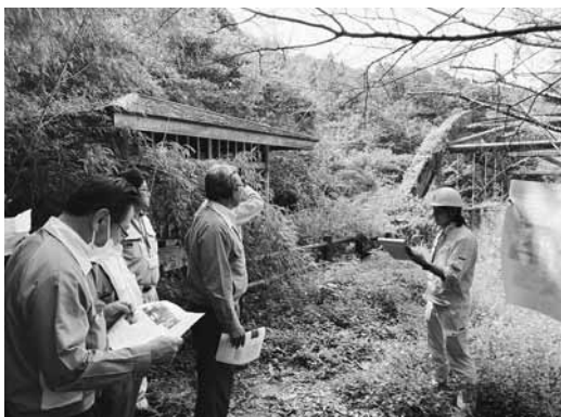
尻追の橋、桑月の橋（七山）