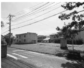
虹の松原学園前公園候補地

その他の質問 ◎土砂災害後の復旧・防災について ◎子供を産み育てやすい環境作りについて ◎病児病後児保育の拡充について ◎蔽木・きゆうショップについて