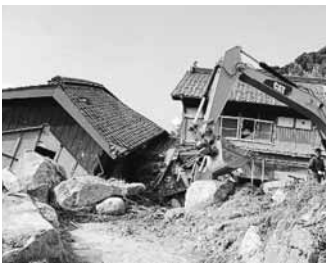
被災した住宅の復旧作業が進む今坂地区