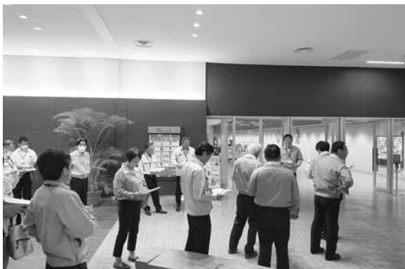
唐津市モーターボート競走場(原)