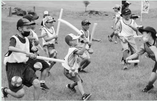
サムライ合戦全国大会 in 肥前名護屋城