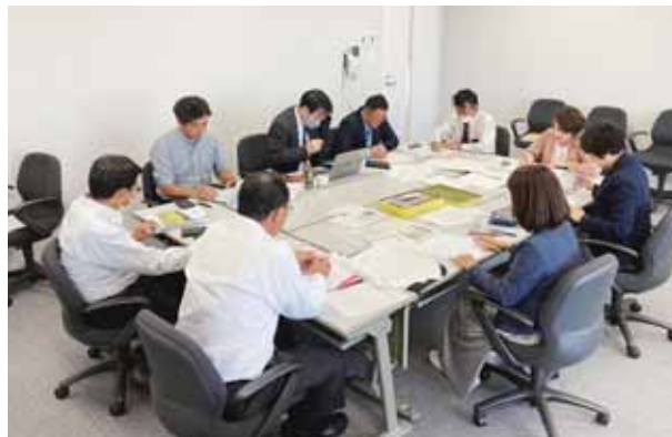
議会だより編集作業中です