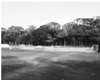
松浦河畔公園スケートボード場

質問 アドベンチャートラベルに取り組む考えは。 地域 アクティビティ、自然、異文化の体験の3要素のうち、2つ以上の要素で構成される旅行形態で、海外で注目されている。国内だけではなく訪日外国人にも魅力的な商品となるよう検討する。 「スポーツパーク」の整備について