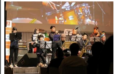
市民協働事業イメージ