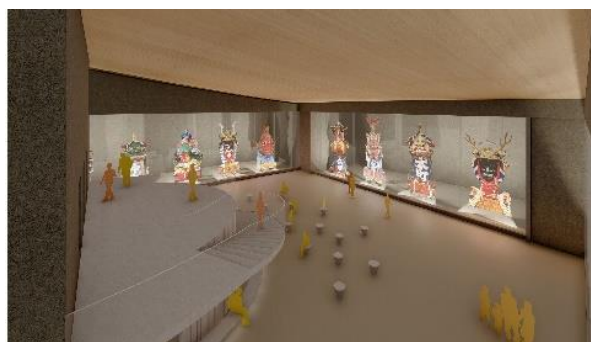
曳山展示場イメージ