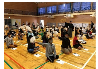
ワークショップイメージ