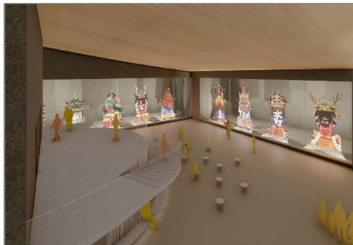
上左 施設外観 (東側より)