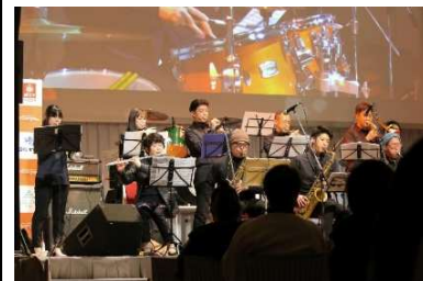
市民協働事業イメージ