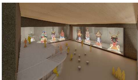
曳山展示場イメージ