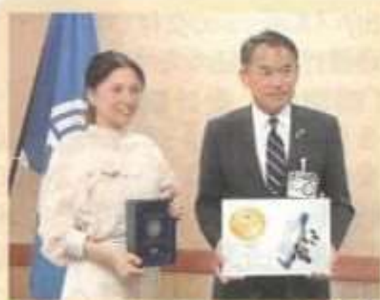
▲令和3年10月14日に市長表敬訪問し、受賞を報告