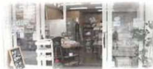
▲ギャラリー入り口

「JCCポップアップギャラリー」では、JCCの活動紹介や地産素材を活用した化粧品などを展示・販売しているほか、市内の高校生とJCCが共同して商品開発を行うなど、地域との連携・交流にも取り組んでいます！