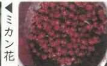
▶ ミカン花 ▶ ローゼル