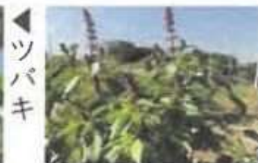
▶ ツバキ ▶ ホーリーバジル