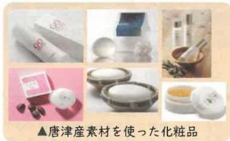
▲唐津産素材を使った化粧品