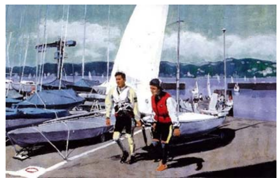
秋玲二「ヨットハーバーB(曳艇)」