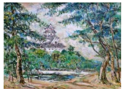
檜崎重視「松と城(唐津追想)」