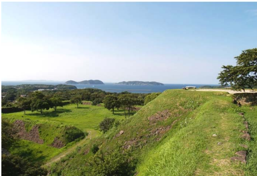
名護屋城跡（本丸から見た景色）

時における政治・経済・文化の中心地として歴史上重要な位置付けをもつ遺跡と高く評価されており、名護屋城跡と 23 か所の陣跡は特別史跡に指定されている。