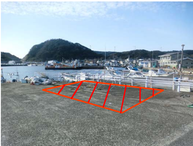
03物件の保管予定箇所