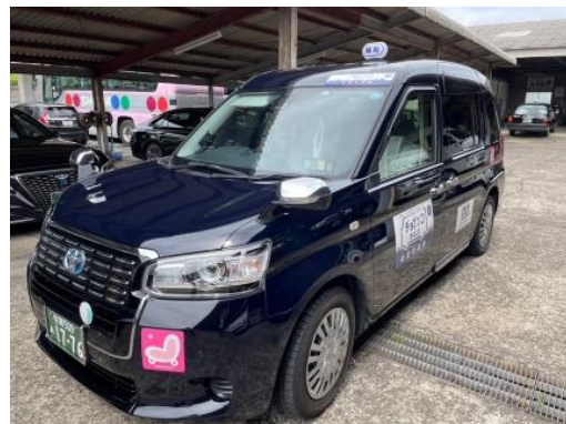
車両イメージ ※日によって車種が違います。