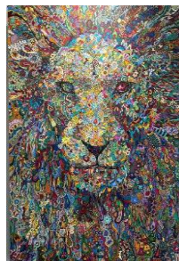
ライオン ペン 2023