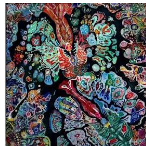
胡蝶蘭 ろうけつ染 2023 綿、ハンノール染料