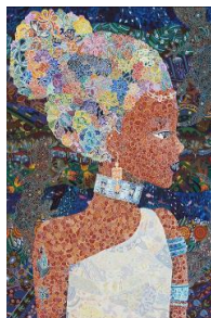
個性 ペン 2020