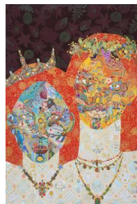
幼い頃の思い出 ペン 2021