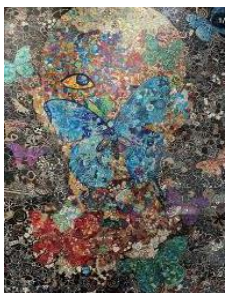
蝶 ペン 2019