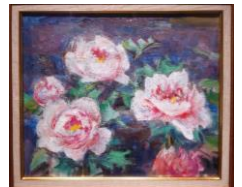
ねっとりとした油彩