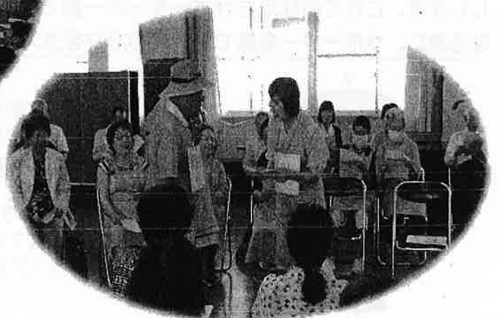
東唐津サロンで開催