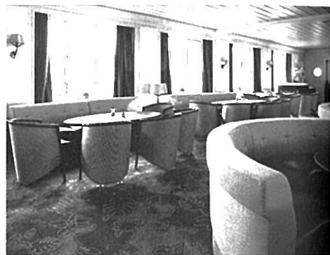
「パノラマ・ラウンジ」

日本郵船が三菱重工神戸造船所で建造した「フロンティア・スピリット」(フロンティア・クルーズ運航)が前身。1993年にハバグロイドに移籍し、以来「ブレーメン」として運航している。上陸用のゾディアック・ボートを備え、ヘリコプターパッドを装備し、アイスクラス1Aスーパーにランクされる同船の就航先は、極地やアマゾン、アフリカなど世界各地の秘境だ。ショーなどのイベントはないが、船上では寄港地などに関するレクチャーを実施。食事の質は高く、英語とドイツ語を話すウエーターによる親身なサービスが受けられる。操舵室はほぼ常時開放。探検船としては一級サービスの客船。