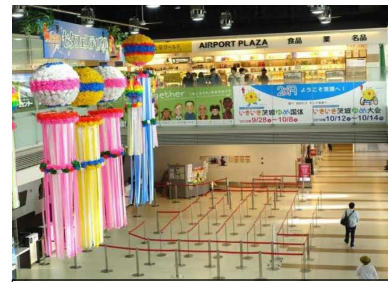
茨城空港の横断幕装飾