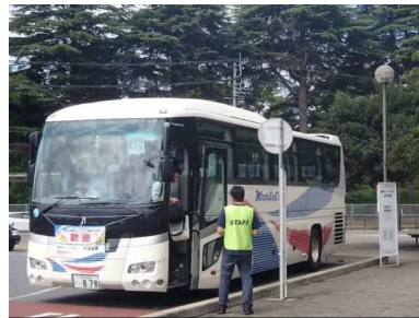
無料シャトルバス