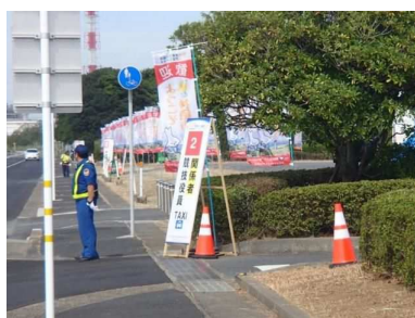
警備員による駐車場の誘導