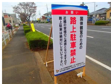
路上駐車禁止看板