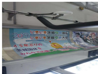
国体PRポスター（バス）