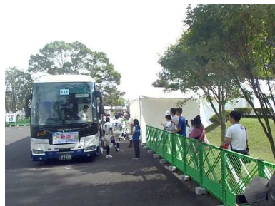
選手・監督の輸送（高校野球）