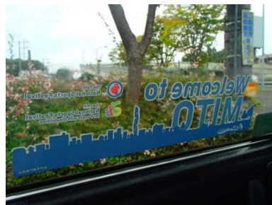
国体PRシール（タクシー）