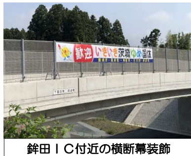
鉾田 I C 付近の横断幕装飾