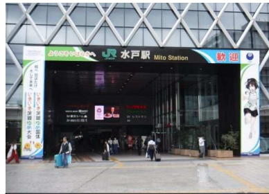
南口の歓迎ゲート