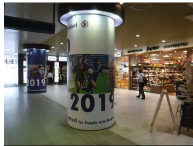
駅構内の円柱装飾