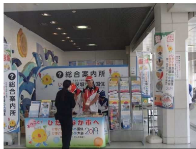
ひたちなか駅構内