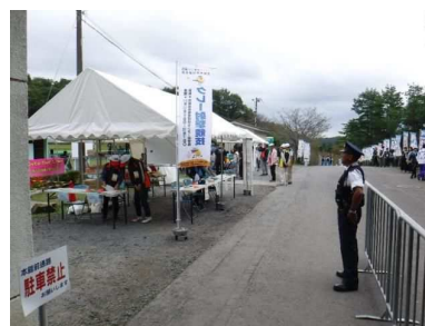
警察署による会場巡視