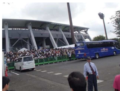
警備員による雑踏警備