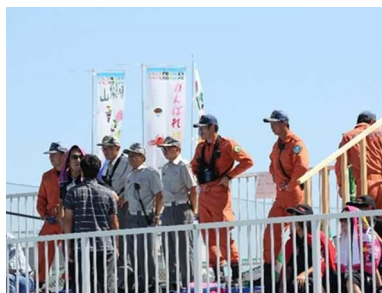
消防署による会場巡回