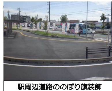
駅周辺道路ののぼり旗装飾