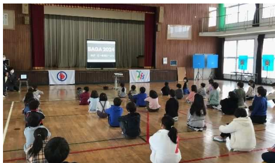
東唐津小学校（11月11日開催）

SAGA2024国スポ・全障スポの全体調整を担う県と競技会の運営を担う市町が連携して、理解・協力を得られた小中学校及び高等学校を訪問し、大会に関する出前授業を行うことで、児童・生徒にスポーツを「する」「観る」「支える」などの様々な機会等を創出し、SAGA2024の認知度や参加意欲の向上を図ることを目的に実施しています。