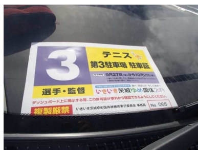
関係者駐車場の駐車証