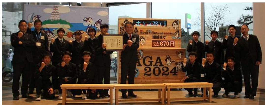
(唐津市役所本庁1階エントランスホールに設置)