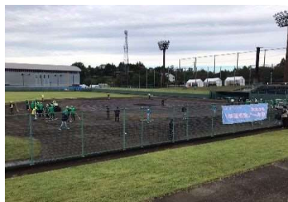
大会会場（バドミントン）