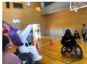
車いすバスケットボール（湊小学校）