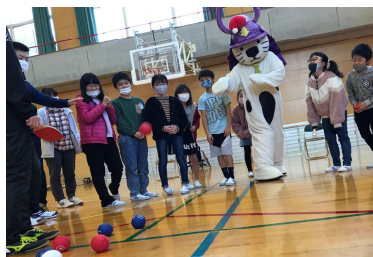
ポッチャ（湊小学校）