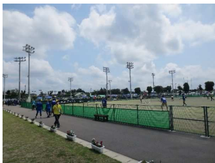
栃木リハーサル大会（ソフトテニス）