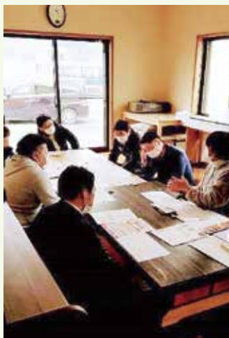
↑市内事業主のパパとママ6人によるトークセッションの様子

この取り組みでは、令和2年度に実施した「仕事と子育てに関するワークライフバランスアンケート」の結果を受けて、男女共に仕事と子育てがしやすい唐津になるためのヒントを得ようと、次の世代を担う高校生と一緒に、子育てしながら働くお父さん、お母さんへのインタビューと子育て世帯が関わる職場へのインタビューと取材やトークセッションが行われました。