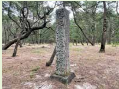
領境石『従是東対州領』/砂子地区 漁場境石『従是東濱崎浦漁場』/松原内

賀市)とならび、日本三大松原のひとつに数えられ、この中で唯一国の特別名勝に指定されています。