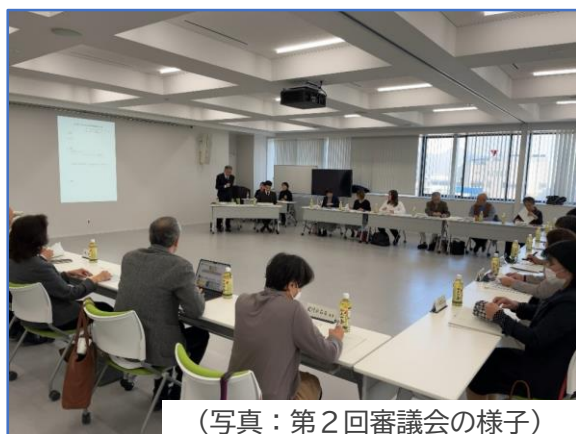
(写真：第2回審議会の様子)