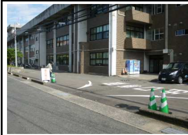
第2駐車場出口 出口専用です