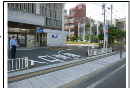
第2駐車場入口 入口専用です