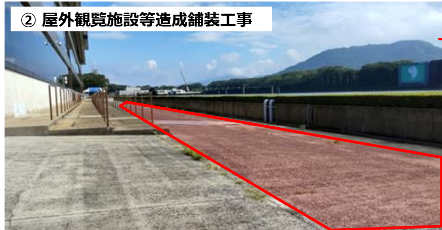
② 屋外観覧施設等造成舗装工事

屋外観戦エリア付近に舟券発売所を増設 53,955千円 鉄骨平屋建約40㎡、既存フェンス撤去など