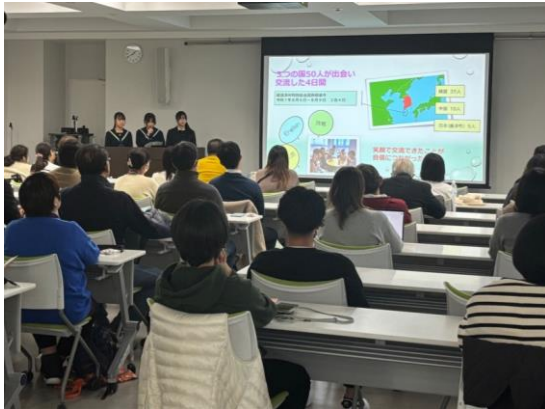
中高生の国際交流活動報告会の様子(11月開催)

唐津市と済州特別自治道西帰浦市は、姉妹都市を締結して今年で31年を迎え、これまでにさまざまな交流を重ねてきました。今回の訪問では、総領事と市長の間で、この長年にわたる友好交流を振り返るとともに、直行便就航を契機として、青少年をはじめとする市民交流や観光、文化、経済など幅広い分野での交流活性化につながる具体的な一歩となることを期待しています。