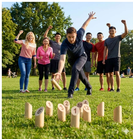
モルックのイメージ