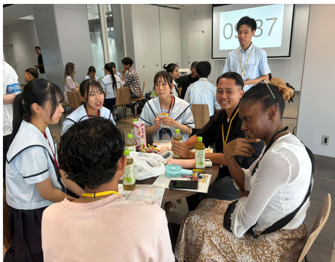
これまでの交流会は「話すこと」が中心

こうした背景を受け、唐津市では3月1日（日）、言葉の壁を越えて誰もが主役になれるフィンランド発祥のスポーツ「モルック」を通じた国際交流イベントを開催します。 日本の伝統的な柔道場を舞台に、裸足で交流を深めるという唐津ならではの試みで、国籍を超えた新しいコミュニティの創出を目指します。