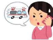
<R7年度 熱中症による救急搬送状況唐津市消防本部>