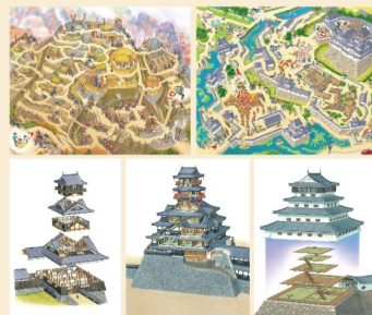
左上から 「戦国の山城」（『お城の迷路』より2024年）、 「お城の公園」（『お城の迷路』より2024年）、 「熊本城宇土櫓」1997年、 「安土城天守（外観監修：西ヶ谷恭弘）」1994年、 「小倉城天守内部の構造」1997年

愛媛県松山市生まれ。武蔵野美術大学大学院終了。舞台背景の仕事を経て、歴史考証イラストレーターとして独立。『歴史群像』（ワン・パブリッシング）でもイラストを発表していた。迷路絵本も手掛け、大ヒット。2023年に日本城郭特別賞受賞。