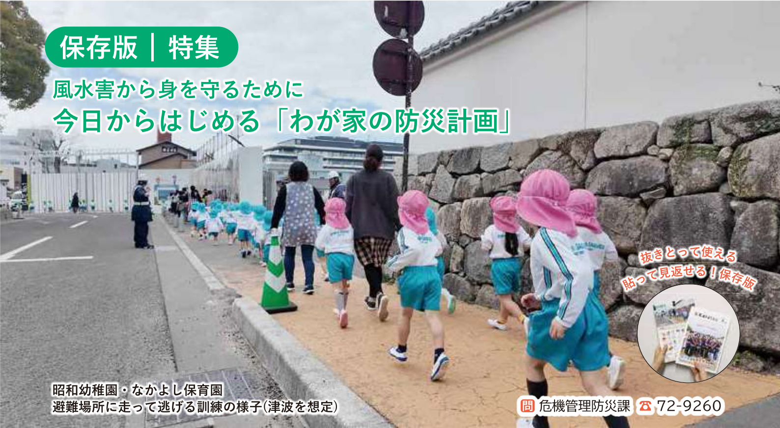
昭和幼稚園・なかよし保育園 避難場所に走って逃げる訓練の様子(津波を想定)