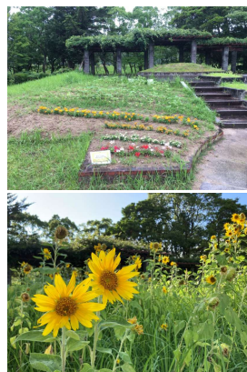
【花壇整備イメージ】 勾配のある花壇の整備

ローラースポーツパークのパークセクションの整備、花いっぱい広場の花壇の整備、遊具広場周辺の水辺の環境整備を行います。