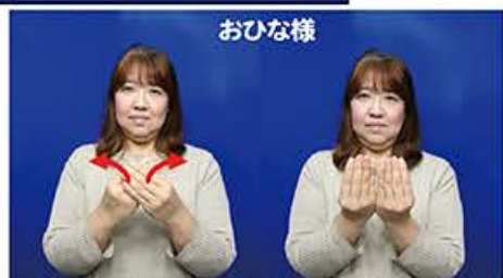
①胸の前でななめに重ねた両手を縦にします。 (扇子が開くようなイメージです)