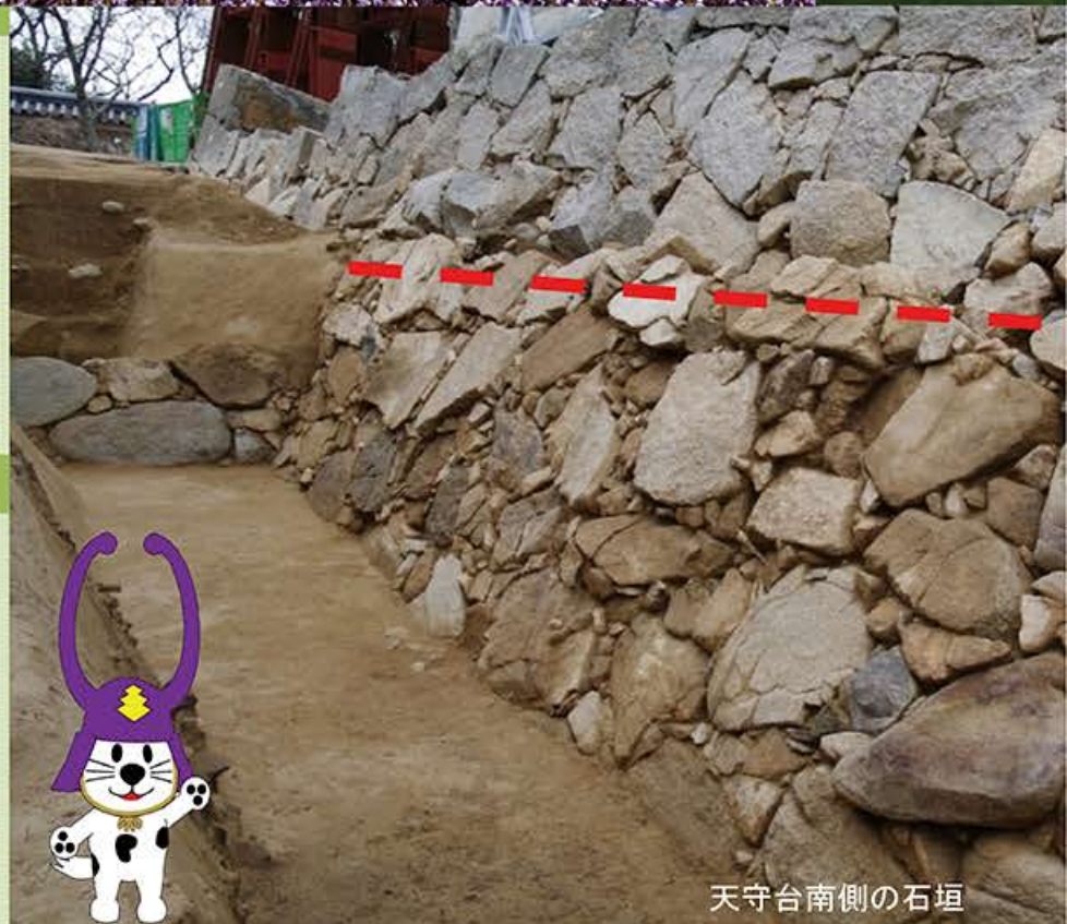
天守台南側の石垣

天守台南側の石垣の下で旧石垣（古い石垣）を発見しました。石垣の写真の上段と下段で石の色が違うのが分かるでしょうか？下段の石垣が、今回発見された旧石垣です。現在の天守台石垣は、旧石垣の上に築かれています。