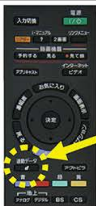
データ放送の dボタン

チャンネルを地上デジタル放送のチャンネルからつ(12チャンネル)に合わせて、リモコンのdボタンを押してご利用ください。その後表示される項目を十字ボタンで選択し、決定ボタンを押すと、情報をご覧いただけます。