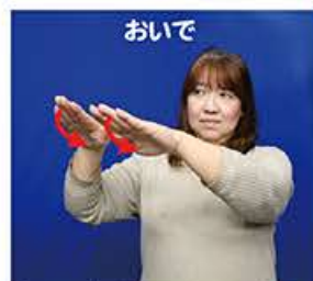
③下に向けた両手で、相手に 「おいて」の動作をします。