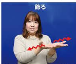
②胸の前で上に向けて両手を開き、 上下に振りながら左右に開きます。